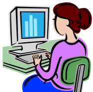
Préparation des campagnes sur PC